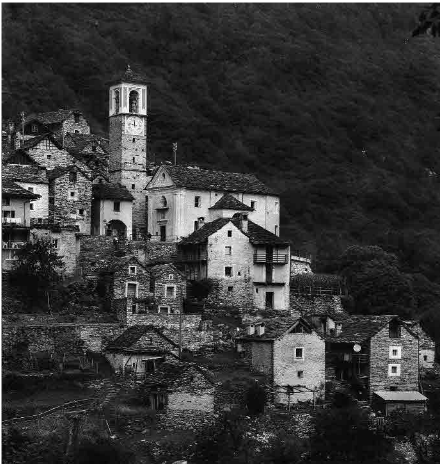
1 La posizione del villaggio in forte pendio

Comune di Corippo, distretto di Locarno, Cantone Ticino