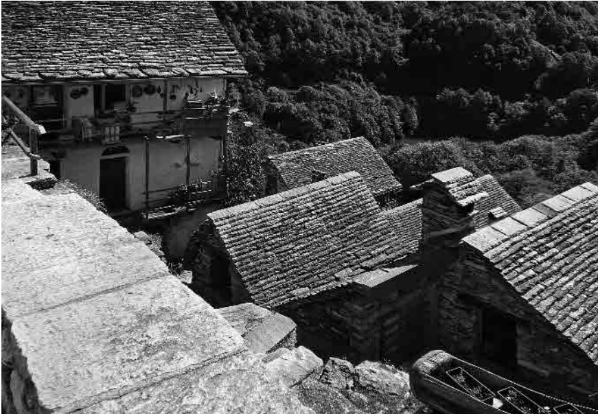
5 Dal sagrato, vista sui tetti in piodè