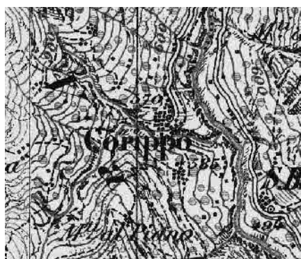
Carta Siegfried 1873/1915

Individuato nel 1975 per la sua esemplarità tipologica e insediativa, conservata fino ad oggi, quale villaggio da tutelare, Corippo gode di una collocazione in un contesto di natura integra, di grande valore paesaggistico, posto su un promontorio tra due valli, a monte del lago artificiale di Vogorno.