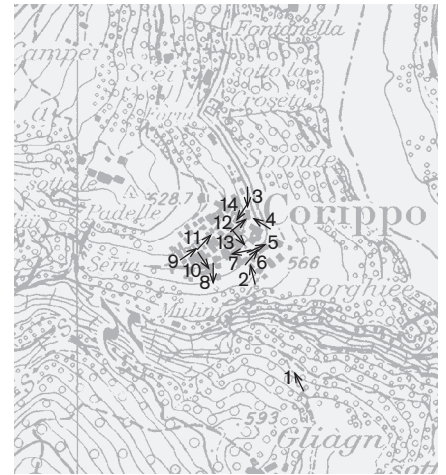
Direzione delle riprese, scala 1: 8 000 Fotografie 2001: 1, 2, 4, 7 Fotografie 2008: 3, 5, 6, 8-14