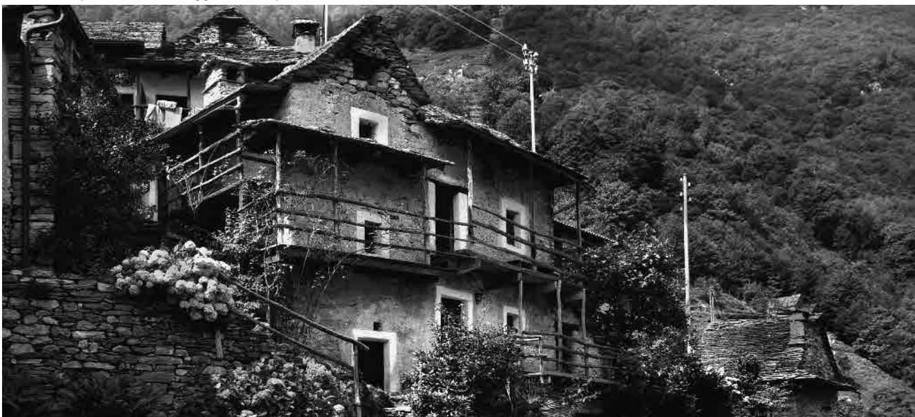
4 Dimora sul margine orientale del nucleo; ballatoi in legno e 'collarini' bianchi alle aperture