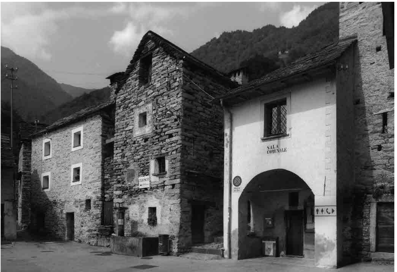
7 Edifici a definizione del lato a monte della piazzetta della chiesa