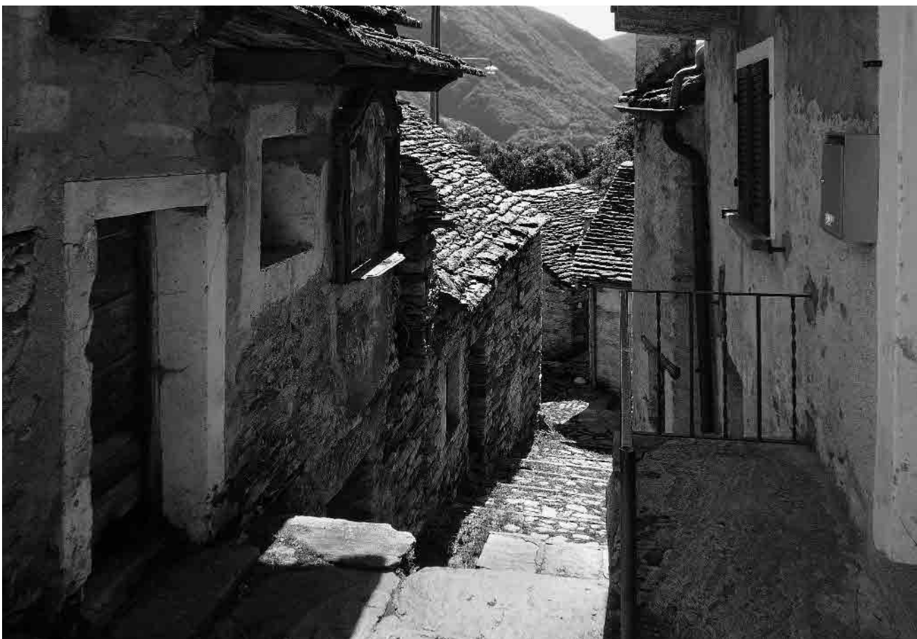
10 Uno dei principali percorsi paralleli al pendio